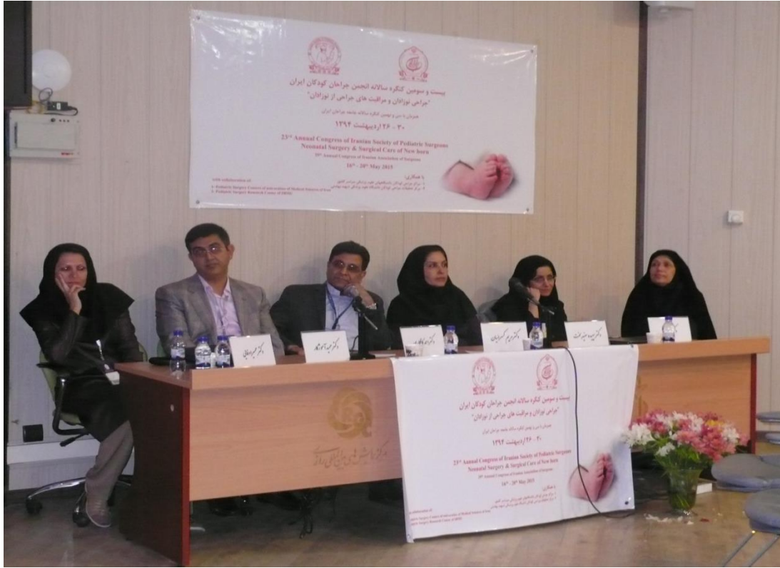
گرداننده: دکتر حمیدرضا فروتن