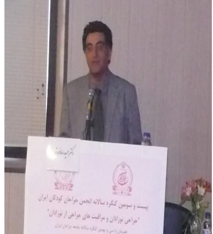
پانل: تازه‌های مداخلات جراحی جنین